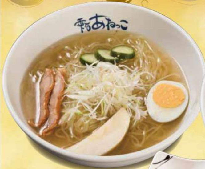
地鶏冷麺 ..... 890円