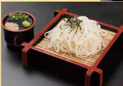
稲庭ざるうどん ..... 780円