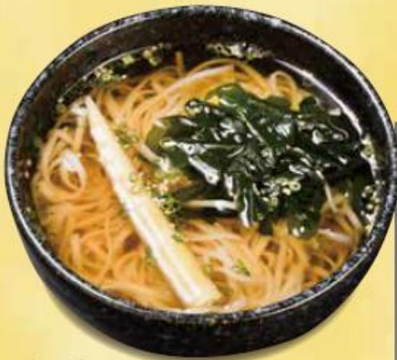
姫竹入り 稲庭温製うどん... 920円