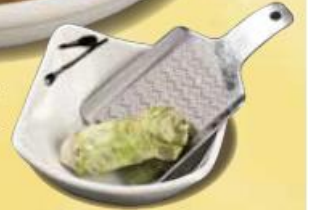
雫石わさび冷麺 ..... 950円