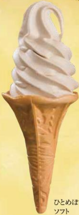
ひとめぼれソフト