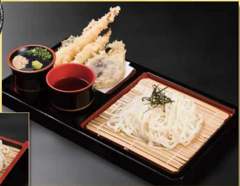
海老と姫竹の稲庭天ざるうどん ..... 1,080円